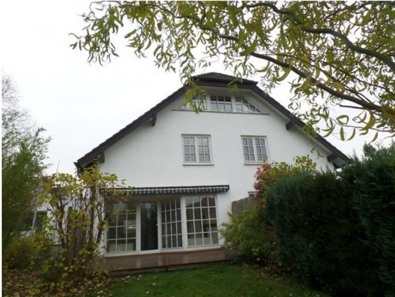
Ansicht vom Garten