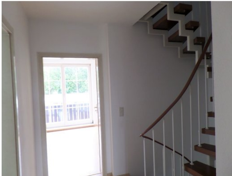
Treppenhaus und Eingang