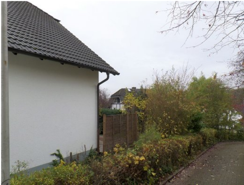
seitlicher Zugang zum Garten